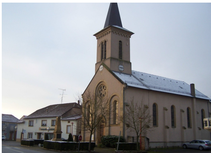
Église de GAVISSE

Arrivé à l'église, « place des tilleuls » prenez à gauche « chemin du calvaire » et redescendez vers la Moselle. Après 50m, bifurquez à gauche de 120° et empruntez les escaliers « soyez vigilant ». En bas, prenez à droite et continuez tout droit « balisage anneau jaune ». A la fin de la piste, quittez le sentier de la Moselle et au « stop », continuez tout droit pour rejoindre votre point de départ et GAVISSE (attention à la circulation routière)