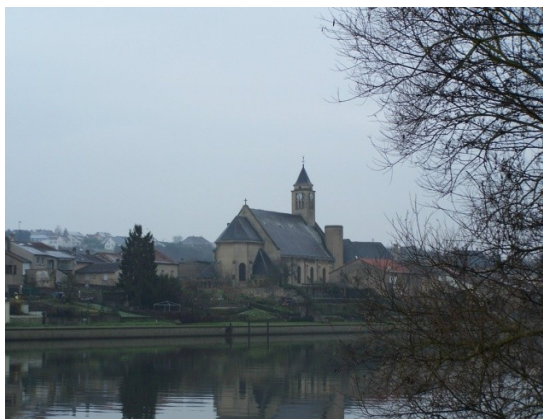
Église de RETTEL