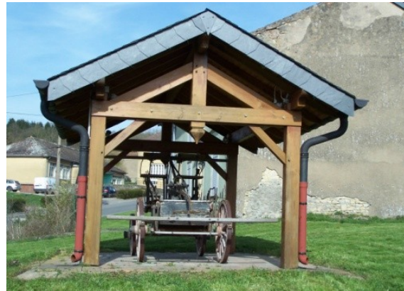
Eglise de HAUTE -CONTZ

descendez vers le village de HAUTE- CONTZ , tournez à droite après le chalet. Longez un ruisseau sur 200m puis tournez à droite. Monter dans le village par la rue principale. Au carrefour, continuez tout droit direction « domaine du cloître ». Environ 100m avant l'église, bifurquez a droite « chemin de haut Hedling » (on quitte le GR5F). Descendez et longez la vigne et le cimetière . Au « stop » tournez à gauche et longez la route ( attention à la circulation routière ) Après 100m traversez la route et prenez « le chemin de la Moselle » vers THONVILLE . (5 km ont été parcourus) Découvrez le village de RETTEL sur l'autre rive de la Moselle. Après 3,5 km sur la piste cyclable, tournez à droite et montez vers BERG sur MOSELLE