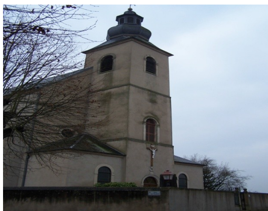
Église de BERG sur MOSELLE