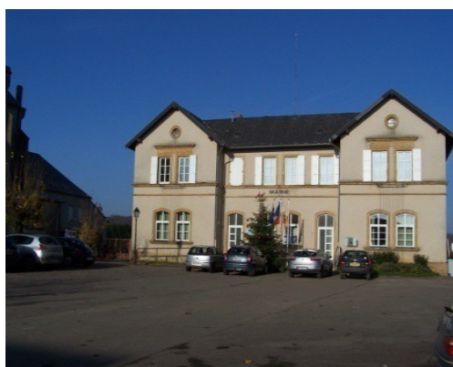
Mairie de ZOUFFTGEN